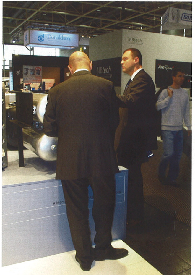
Großes Interesse auf der IAA am neuen Anbringungssystem