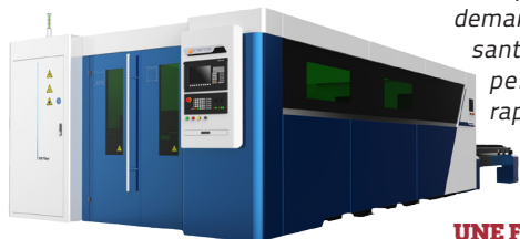
Découpeur laser fibre EXPERT Laser 30.15.

La presse plieuse PRO Bend d'Oriance pour SAG France est particulièrement bien équipée, non seulement au niveau des 7 axes, de sa commande numérique à écran tactile, mais aussi au niveau des aides au pliage, compléments indispensables pour la réalisation de grandes pièces, qui soulagent les opérateurs des tâches pénibles et dangereuses. Outre le rapport qualité/prix des 3 machines Oriance, cette richesse de fonctionnalités a été un autre atout de choix pour SAG France qui est certifiée IATF 16949, ISO9001, ISO14001 et OHSAS18001. ■